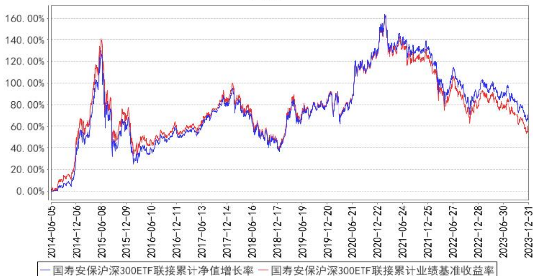
国寿安保沪深300ETF联接累计净值增长率与同期业绩比较基准收益率的历史走势对比图

注：本基金基金合同生效日为 2014 年 06 月 05 日，按照本基金的基金合同规定，自基金合同生效之日起 6 个月内使基金的投资组合比例符合基金合同关于投资范围和投资限制的有关约定。本基金建仓期结束时各项资产配置比例符合基金合同约定。图示日期为 2014 年 06 月 05 日至 2023 年 12 月 31 日。