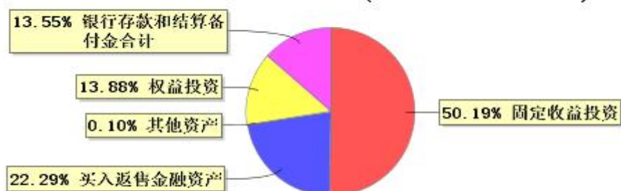
投资组合资产配置图表 (2023年12月31日)

● 固定收益投资 ● 买入返售金融资产 ● 其他资产 ● 权益投资 ● 银行存款和结算备付金合计