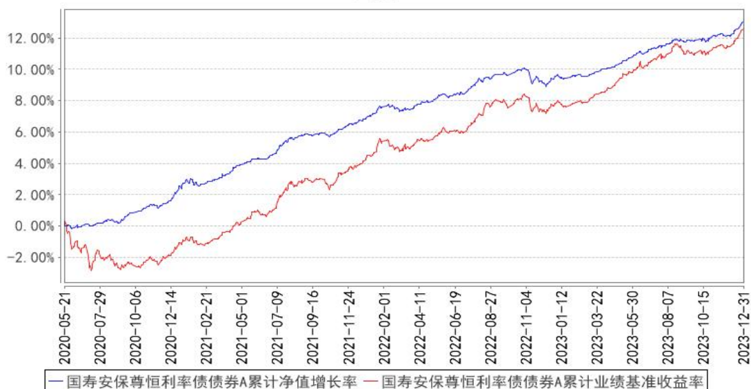
国寿安保尊恒利率债债券A累计净值增长率与同期业绩比较基准收益率的历史走势图