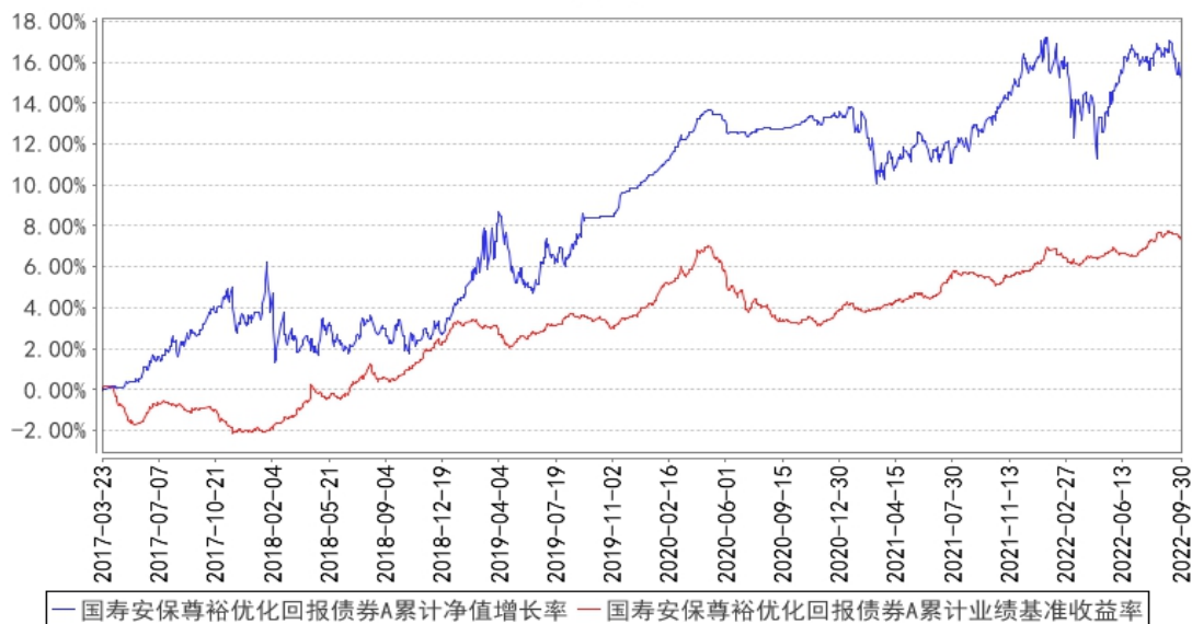
国寿安保尊裕优化回报债券A累计净值增长率与同期业绩比较基准收益率的历史走势对比图