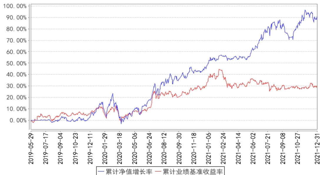
国寿安保新蓝筹混合累计净值增长率与同期业绩比较基准收益率的历史走势对比图

注：本基金基金合同生效日为 2019 年 05 月 29 日，按照本基金的基金合同规定，自基金合同生效之日起 6 个月内使基金的投资组合比例符合基金合同关于投资范围和投资限制的有关约定。本基金建仓期结束时各项资产配置比例符合基金合同约定。图示日期为 2019 年 05 月 29 日至 2021 年 12 月 31 日。