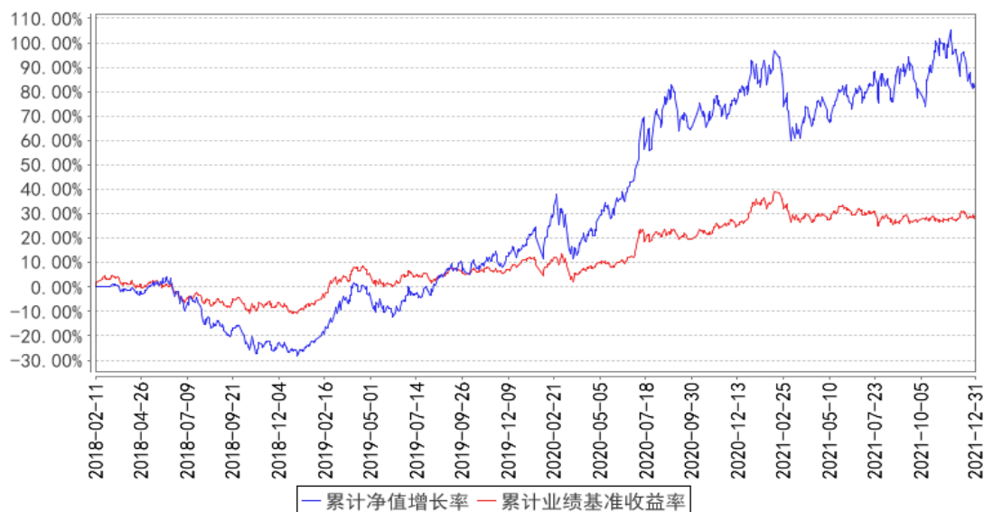
国寿安保消费新蓝海混合累计净值增长率与同期业绩比较基准收益率的历史走势对比图

注：本基金基金合同生效日为 2018 年 02 月 11 日，按照本基金的基金合同规定，自基金合同生效之日起 6 个月内使基金的投资组合比例符合基金合同关于投资范围和投资限制的有关约定。本基金建仓期结束时各项资产配置比例符合基金合同约定。图示日期为 2018 年 02 月 11 日至 2021 年 12 月 31 日。